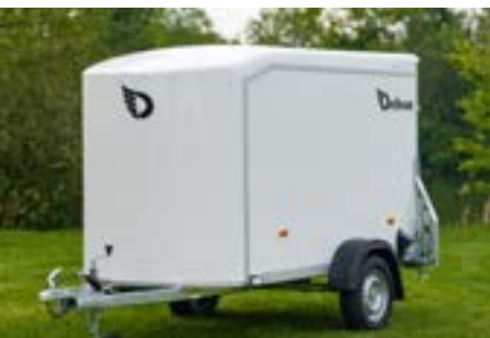
Version sans frein